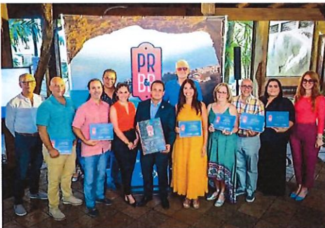
Turismo Lanza Nueva Imagen De Hospederías