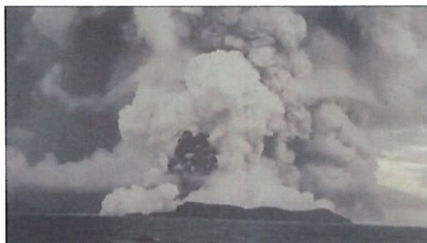
Erupción De Volcán Submarino Deja Efectos A Través Del Pacífico