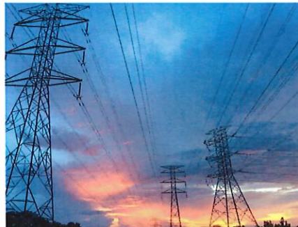
Gobernador Firma Orden Ejecutiva Para Considerar El Hidrógeno Entre Las Fuentes