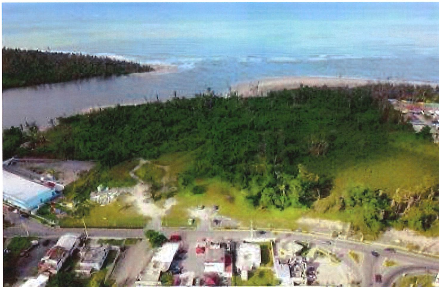
Finca Renacer en Loíza